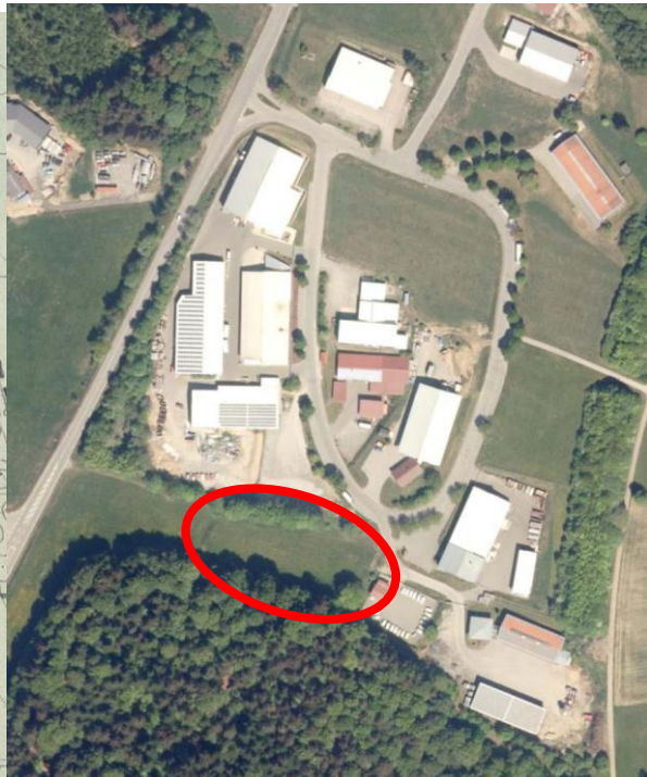
Luftbild, rot markiert der Änderungsbereich